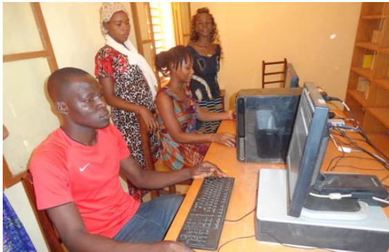
Biblioteca: nuovi PC e spazio informatico

Come in passato è stata assicurata la continuità di vari progetti: mense e sostegno scolastico nei villaggi, biblioteca di quartiere, garderie , corso di alfabetizzazione, borse di studio, infermiere ambulante, pozzi nei villaggi, contributi vari per la gestione (direzione, segretaria-contabile, autista, coordinatore pedagogico).