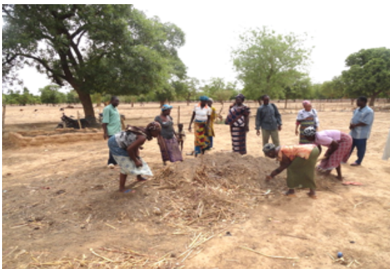
Bilinga: colture agricole, corso di compostaggio