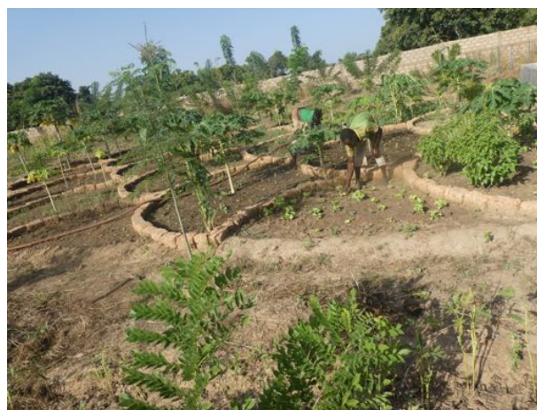
Loumbila: château d'eau con pompa solare, seconda case e nuova paillotte , attività agricole