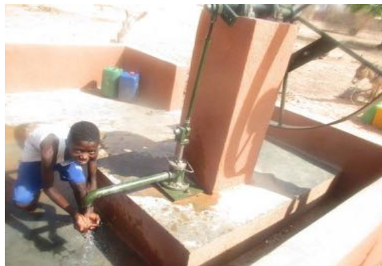
Scuola di Boundoukamba: nuovo pozzo e pompa